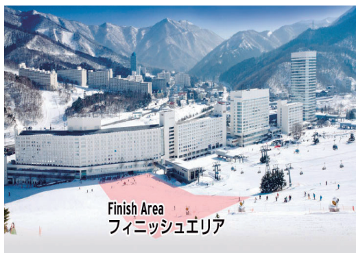
Finish Area フィニッシュエリア