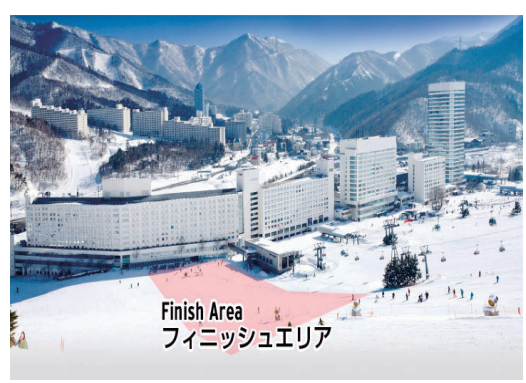
Finish Area フィニッシュエリア

チケットをお持ちの方は、JR 越後湯沢駅より会場までのシャトルバスが出ます 2月13日 14日共 越後湯沢駅前発 午前7時から9時まで 苗場会場発 午後2時から4時30分まで ※車で直接会場に行かれる方は「苗場スキー場駐車場」(有料)をご利用ください