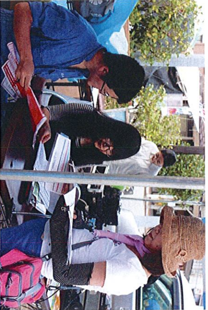
↑ 番組案内は、山崎麻里AN

8月15日越後湯沢温泉夏祭りが開催され、大花火大会の特別番組を放送しました。花火の番組放送を中心に、観光客の声や、祭り実行委員会の方々の想いもお伝えしました。夜空を焦がす大輪の光の花と音に、会場を埋め尽くす観客と、感動を共にしました。