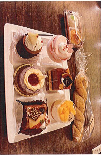
笑顔になる瞬間に、笑顔をたくさん受け取った瞬間に、笑顔になるお客様が嬉しかったです。