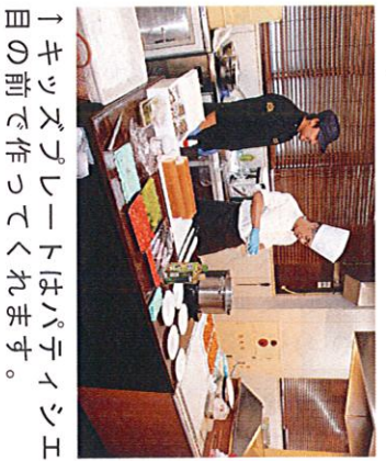
→お土産コーナーも人気でした。